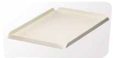
Лотки різних розмірів