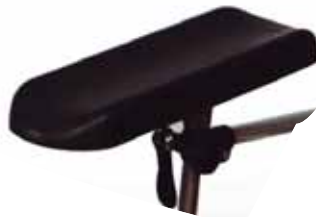
Підлокітник поворотний і регулюється по висоті