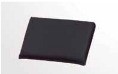
Висота підголівника регулюється

Широкий вибір аксесуарів (для отримання додаткової інформації, будь ласка, зверніться до місцевого дистриб'ютора).