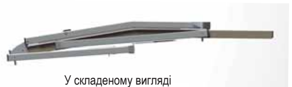
У складеному вигляді