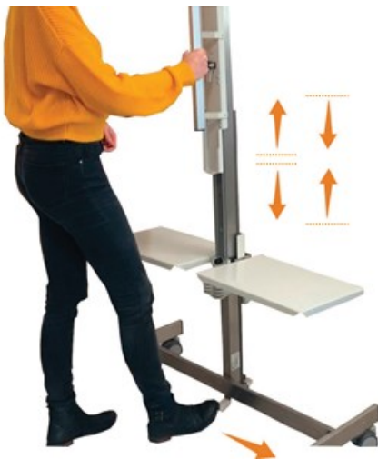
Рух активується натисканням на педаль і підійманням ручки вгору-вниз