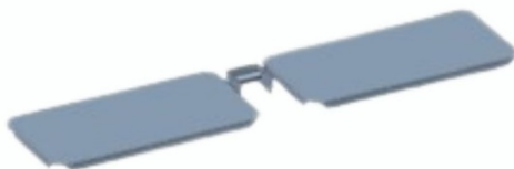
Верхній лоток, що складається та регулюється по висоті