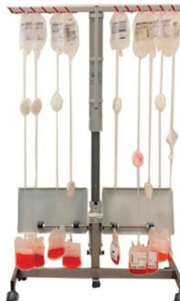
Відстань регулюється завдяки лоткам