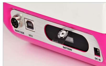
З'ємний Li-Ion акумулятор (ОПЦІЯ)