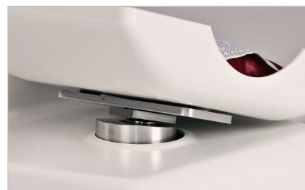
3-D помішування під час здачі крові