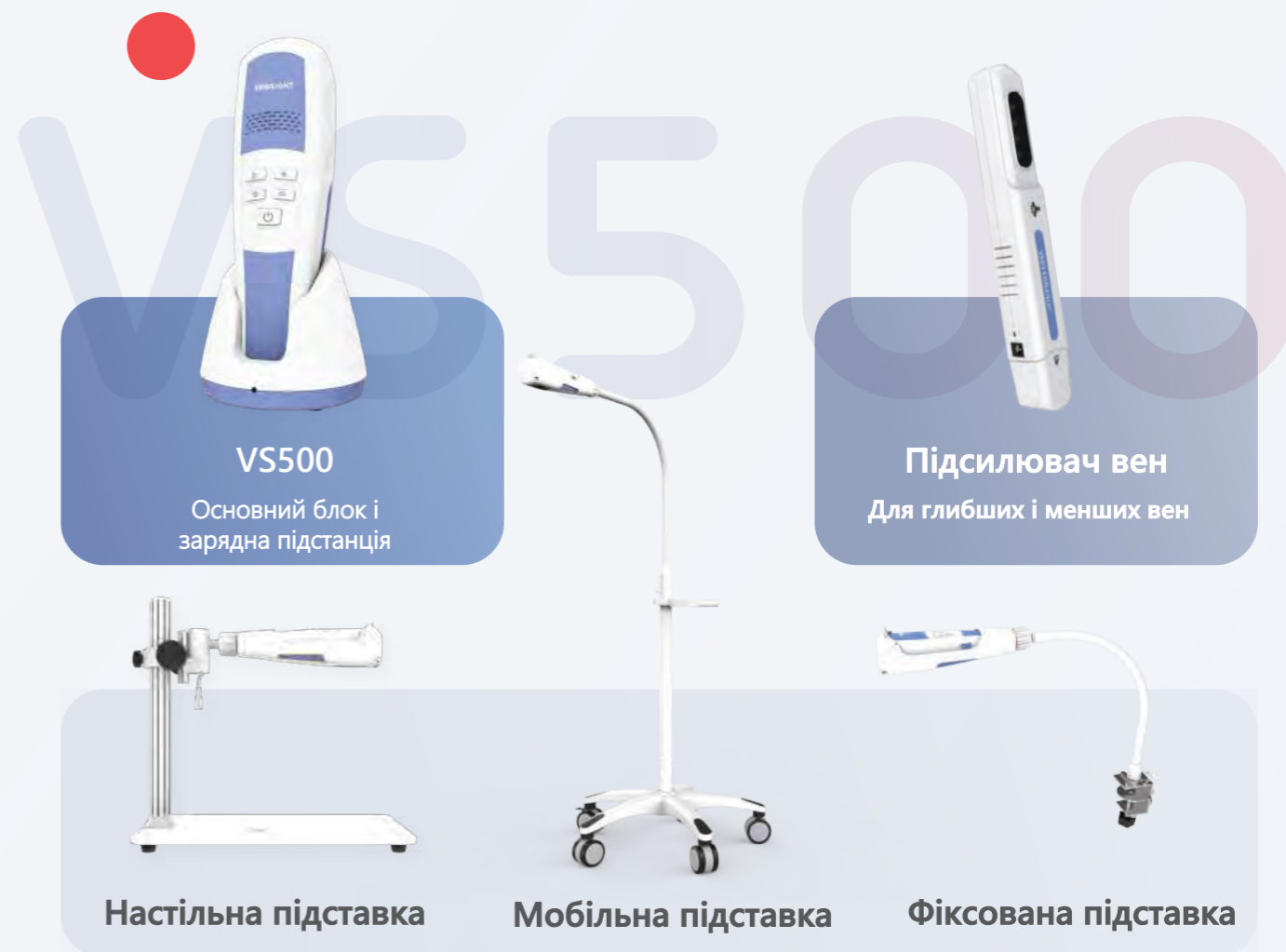
VS500 Основний блок і зарядна підстанція